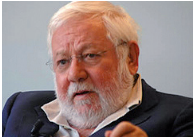
► Paolo Villaggio