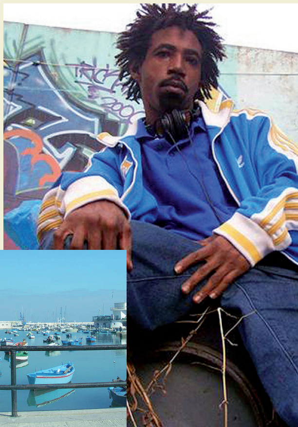
► Akil the Mc

BARI - Seconda serata della III edizione del Festival Menu Kebab: dalle 18 in poi musica, graffiti e break dance con un grande ospite da Los Angeles. E' Akil the Mc from Jurassic 5, rapper statunitense per la prima volta in Puglia. Autore con i suoi compagni di vere e proprie perle, ha rappresentato una speranza per il movimento hip hop, sganciando il genere da stereotipi e gangsterismi. Uno show, quello di Akil, che esalta le sue indiscusse capacità di rimatore e di intrattenitore. Presenterà il suo nuovo Album 'Collection of expression'. E' un hip hop della west Coast (costa del Pacifico californiana), ma che guarda a New York, sempre molto apprezzato da tutto il pubblico europeo. Lo spettacolo, come tutte le altre performances della rassegna, è ad ingresso libero. Akil sarà preceduto, alle ventidue, dal concerto in dj set di Clementino&Tayone, affermati protagonisti della scena hip hop italiana. Prima di loro sarà il turno di Dj BIGFAB, che suonerà, a partire dalle venti, una selezionatissima collezione di brani dalla qualità garantita.