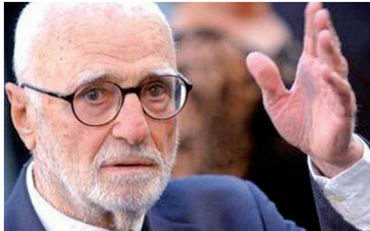
► Mario Monicelli